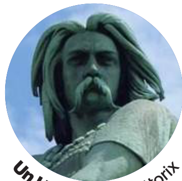
Un Héros Vercingétorix

Places limitées – Un apéritif sera servi dès la fin de la conférence.