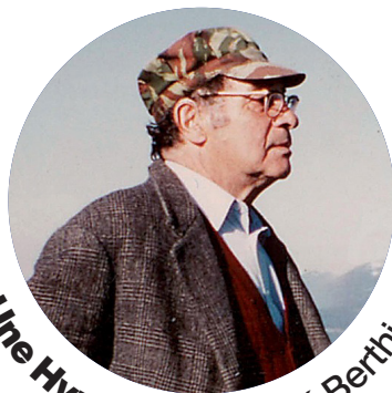
Une Hypothèse André Berthier